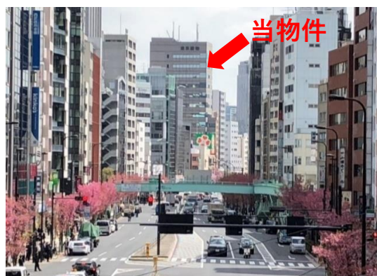
明治通り(渋谷駅東口 歩道橋より撮影)