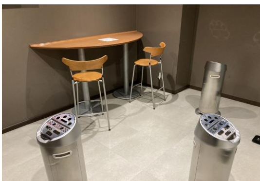
喫煙所(紙タバコ/電子タバコ 分煙)