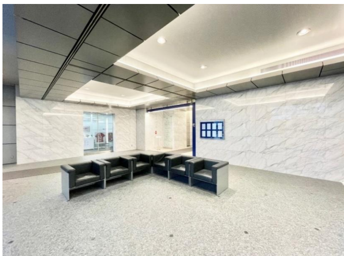
■1階エントランスホール