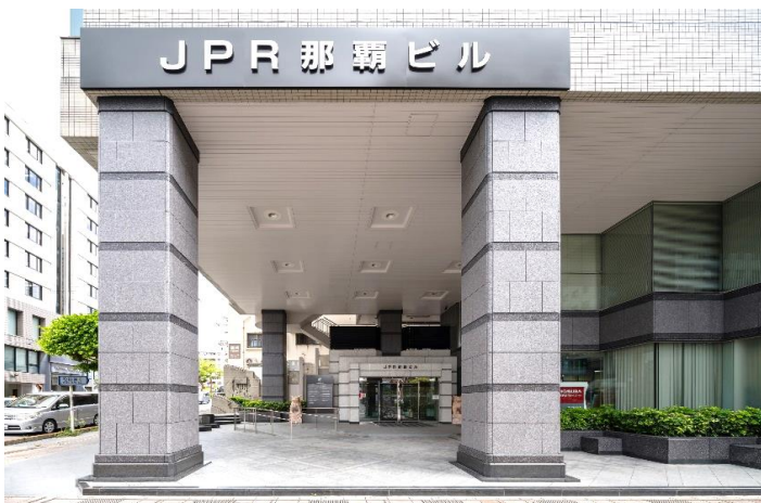
1階エントランス外観