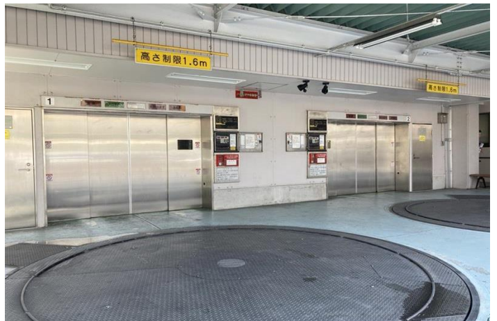
機械式駐車場64台設置 複数台空きあり