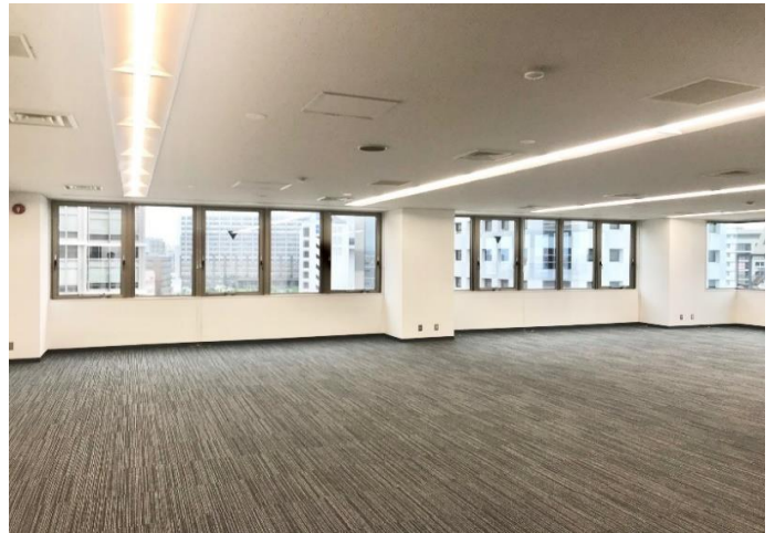
貸室内(LED照明設置済)