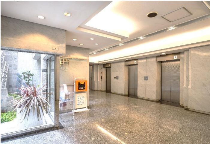
1階エレベーターホール(AED・災害備蓄ボックス設置)