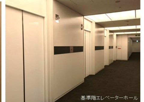
基準階エレベーターホール