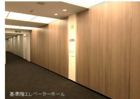
基準階エレベーターホール