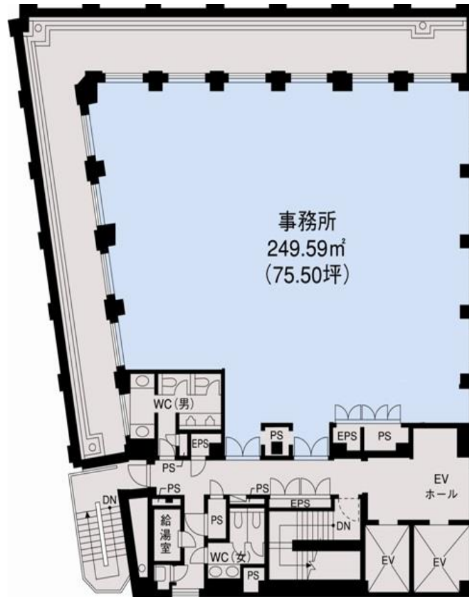
アクロス新川ビル・アネックス