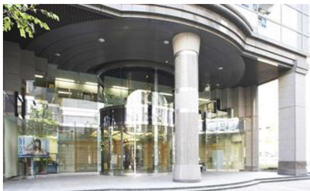
正面エントランス 外観