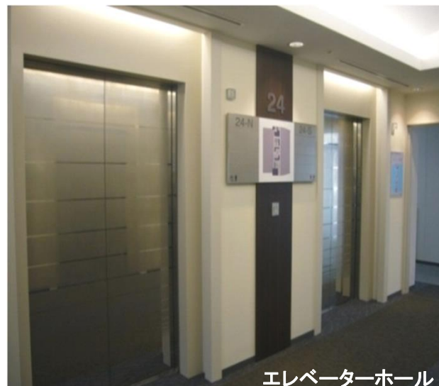
エレベーターホール