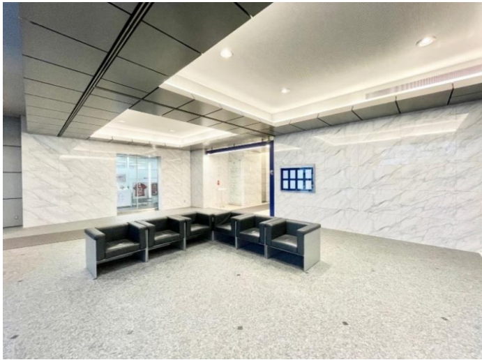
■1階エントランスホール