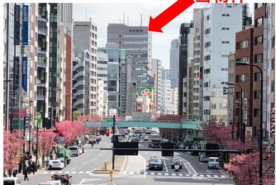
明治通り(渋谷駅東口 歩道橋より撮影)