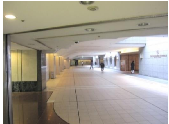
■ジョイナス地下街直結