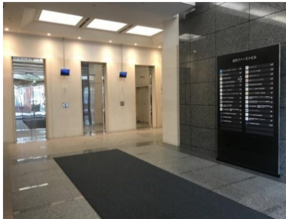
■エントランスホール