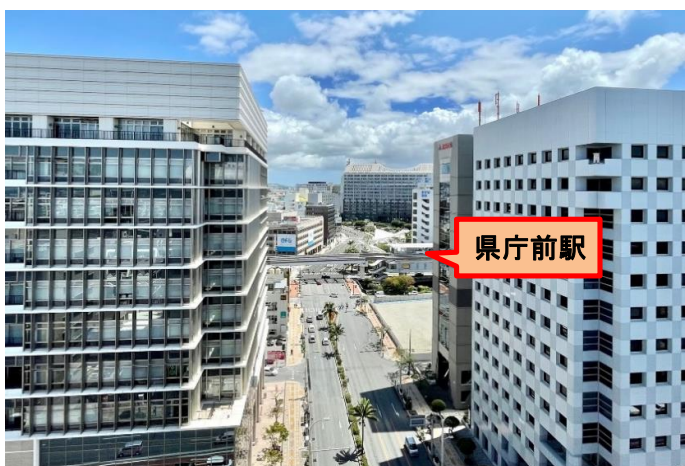
当ビルからの眺望(「県庁前」駅 至近) 那覇オフィス街の中心「久茂地」交差点に面した好立地