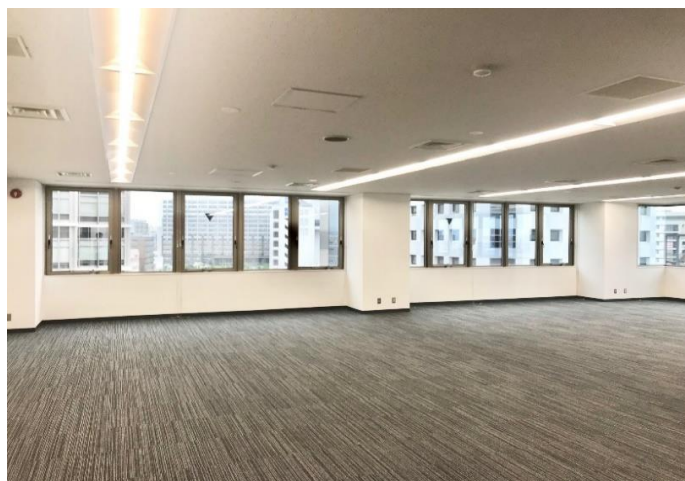
貸室内(LED照明設置済)