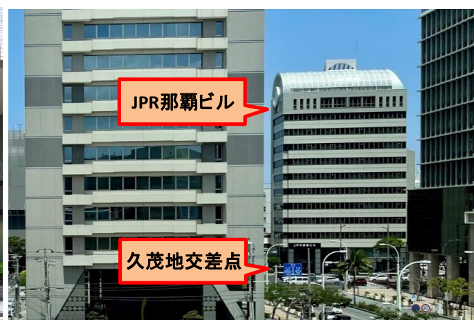
「県庁前」駅から当ビル方面眺望 那覇オフィス街の中心「久茂地」交差点に面した好立地