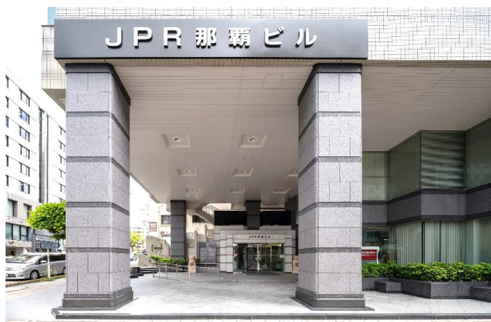
1階エントランス外観