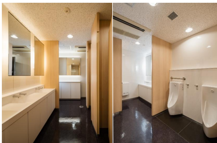
各階男女トイレ(2020年リニューアル完了)