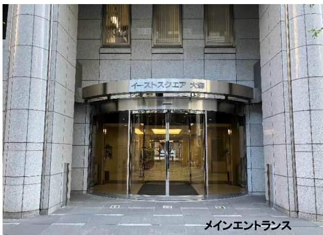
メインエントランス