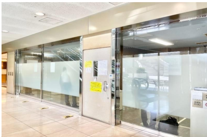
地下1階 館内テナント専用喫煙室