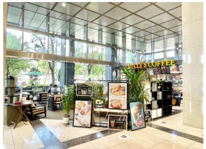
1階エントランスホールのカフェ(タリーズコー)