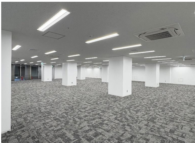
広々とした地下1階事務所専有部