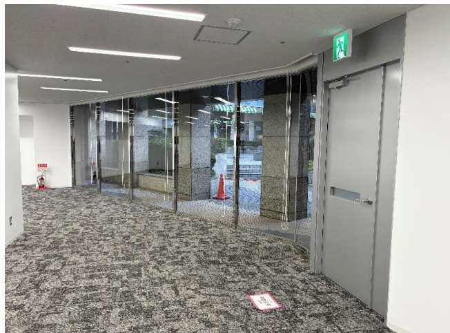
サンクンガーデンに面し、地下1階ながら外光が入ります。