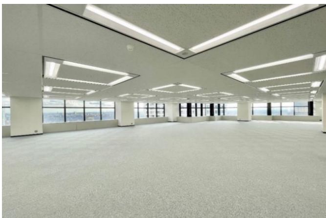
貸室内 LED照明設置済。 大きな窓面によって開放感のある貸室を実現。