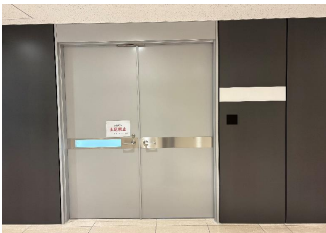
地下1階事務所 廊下側の扉