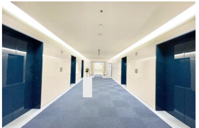
各階ELVホール 低層用と高層用にて分かれており、混雑を緩和。