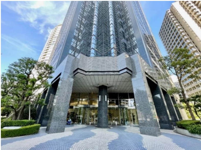
重厚感のあるエントランス外装