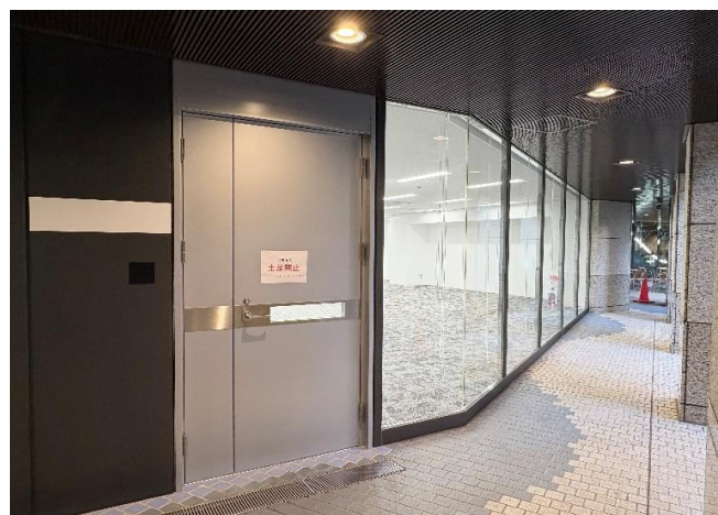
地下1階事務所 サンクンガーデン側の扉