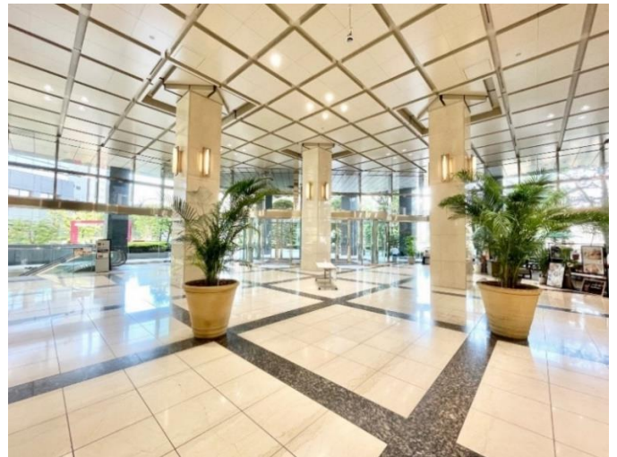
天井高7.5mの広々とした1階エントランスホール