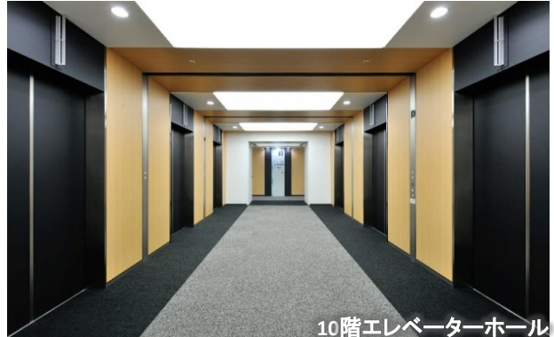
10階エレベーターホール