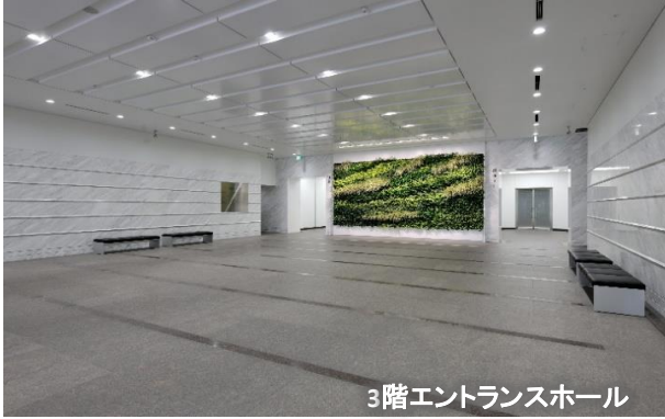
3階エントランスホール