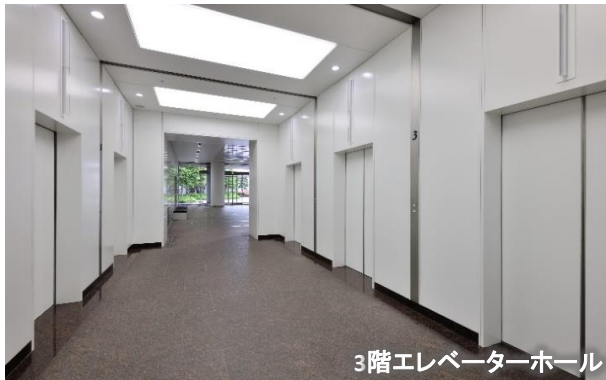
3階エレベーターホール