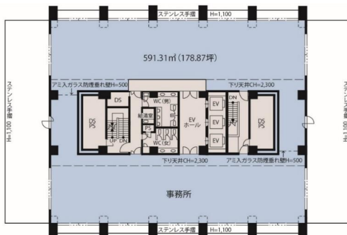
イーストスクエア大森 7階