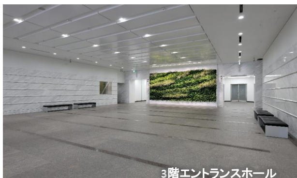
3階エントランスホール

フォトギャラリー (外観・エントランス・各階エレベーターホール・各階トイレ/給湯室 リニューアル済)