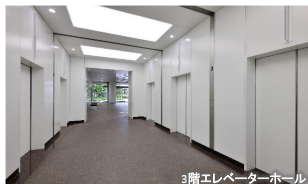
3階エレベーターホール