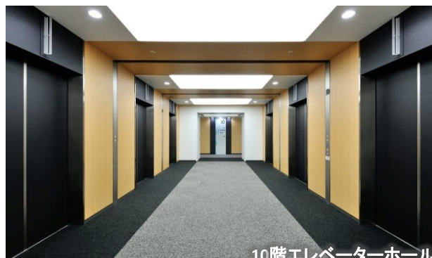
10階エレベーターホール