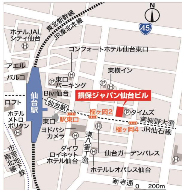
JR各線「仙台駅」徒歩5分