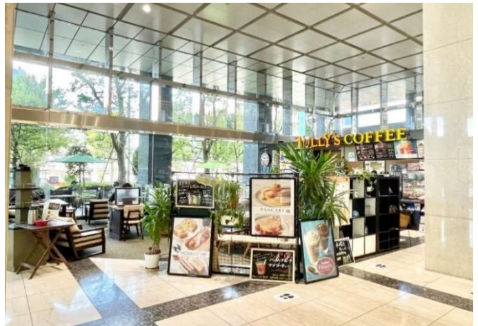
1階エントランスホールのカフェ(タリーズコーヒー)