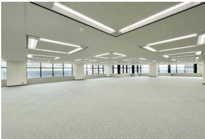
貸室内 LED照明設置済。大きな窓面によって開放感のある貸室を実現。