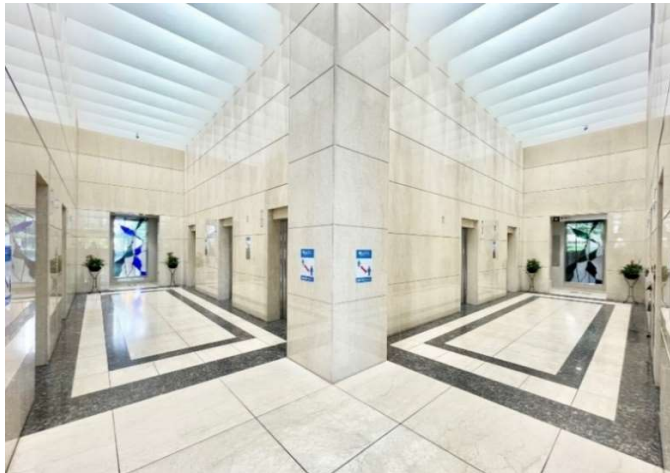
1階ELVホール(高層用5台+低層用5台)