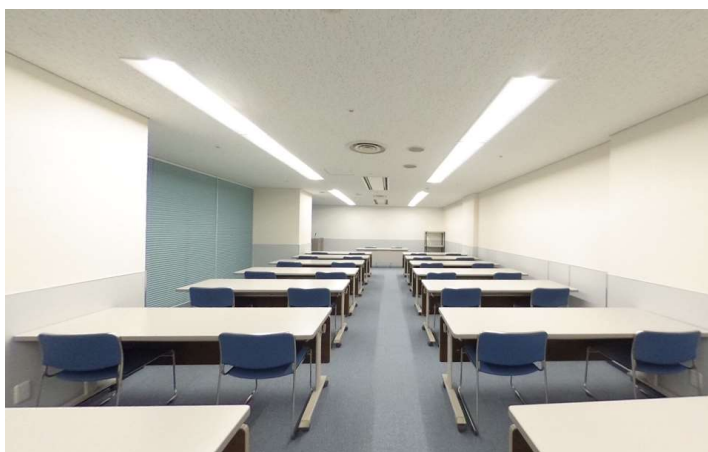
地下1階 貸会議室 (有料) 最大60名収容可能なテナント様専用 貸会議室を用意。 利用可能時間 9:00~21:00土日祝も使用可