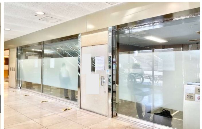
地下1階 館内テナント専用喫煙室