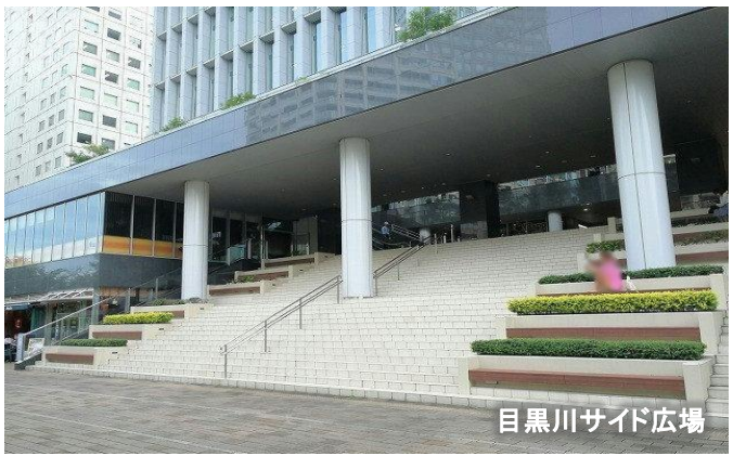
目黒川サイド広場