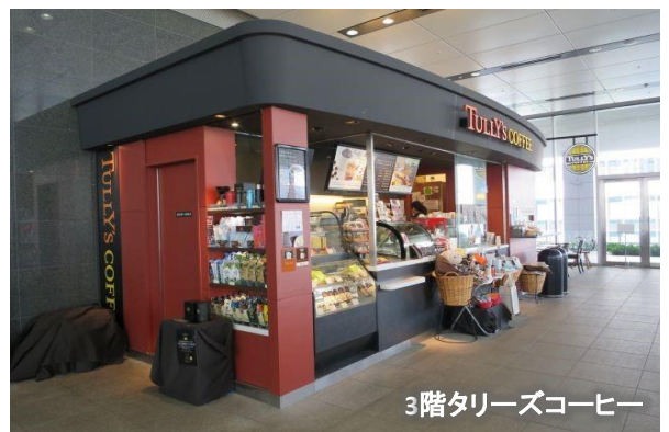
3階タリーズコーヒー