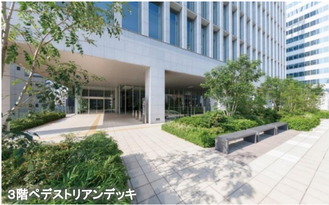
3階ペDESTリアンデッキ