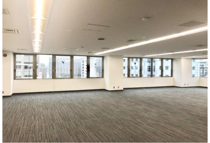
貸室内(LED照明設置済)