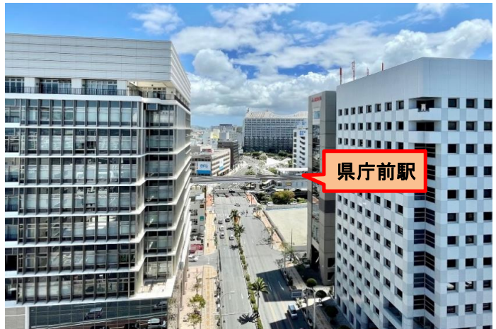
当ビルからの眺望(「県庁前」駅 至近) 那覇オフィス街の中心「久茂地」交差点に面した好立地