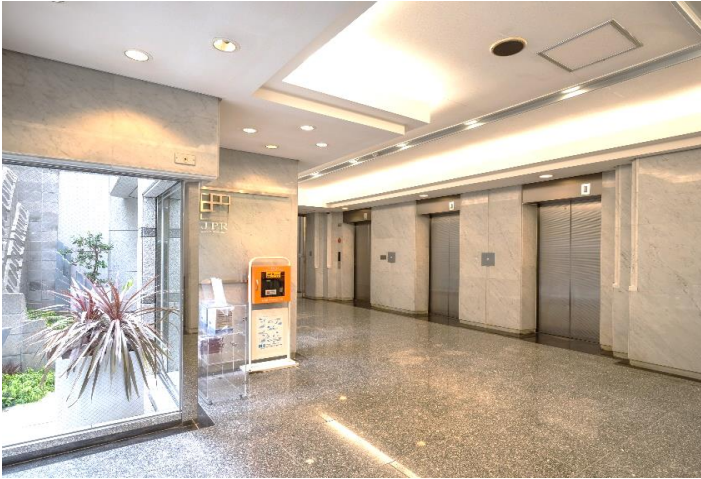
1階エレベーターホール(AED・災害備蓄ボックス設置)