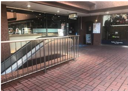
MB飲食店舗 ※★からの視点