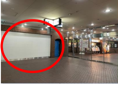
B1飲食店舗② ※★からの視点