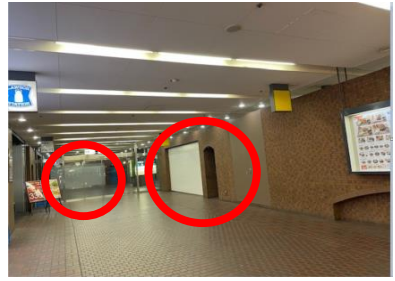
B1飲食店舗①② ※★からの視点