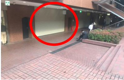
B1物販店舗 ※★からの視点