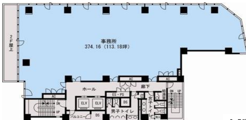
日本橋ファーストビル