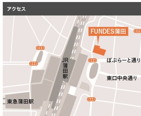
JR京浜東北線 蒲田駅 東口徒歩1分